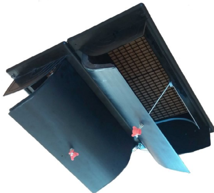
ACCI-xxx-2 двойной клапан

Потолочные приточные клапана серии ACCI-150, ACCI-200, ACCI-300, ACCI-400, предназначены для использования в системах приточной вентиляции свинарников, коровников, крольчатников и других животноводческих и сельскохозяйственных ферм, в которых приток воздуха обеспечивается через потолок помещения.